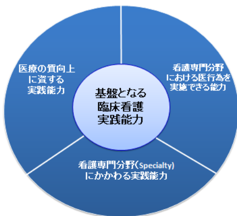
図1. 特定看護師(仮称)の実践力の4要件

4つの要件の概念図を図1に示す。①基盤となるのは、臨床看護実践能力である。複雑(多要因が絡む)な健康問題を査定する包括的な視点を有し、最善の健康状態とQOLを生むために患者と良好なパートナーシップを築き、臨床判断と卓越した技術による看護実践を提供できる能力である。そして、②看護専門分野において健康問題の特殊性、治療の特殊性、医療システムの特殊性に応じて看護実践を提供するspecialtyに係る実践能力が必要とされる。③看護専門分野(specialty)に係る実践能力に根ざし、患者の安全と安心の保証のもとに医行為を実施する。また、④医療の質向上と安全性に資する看護実践を計画・実行し、それを組織的に実行できる実践力が求められる。